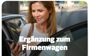
Ergänzung zum Firmenwagen

Große Budgets zur Abdeckung der gesamten Reisekette – von Tür zu Tür