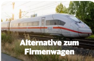
Alternative zum Firmenwagen

Strecken- & zeitunabhängige Ergänzung zum Jobticket mit mittleren Budgethöhen